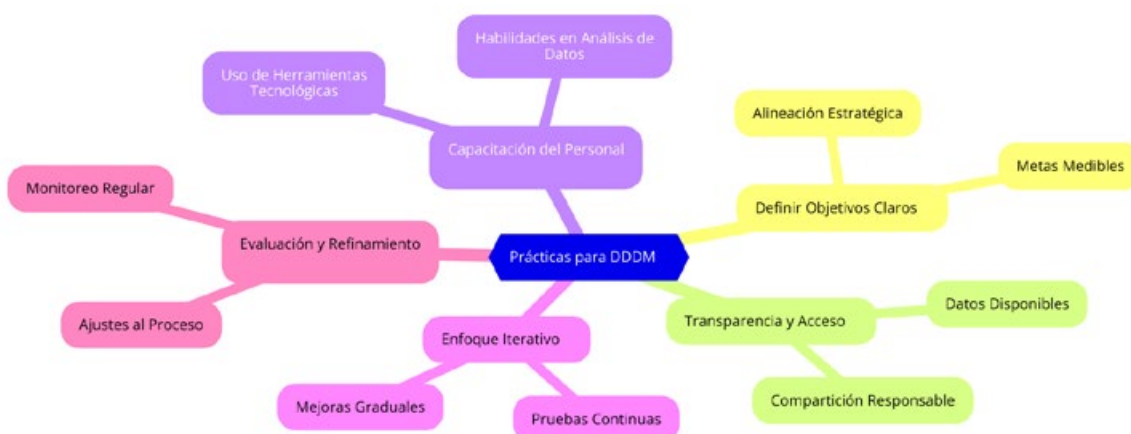
Figura 2 Mejores Prácticas para una Implementación Exitosa de DDDM

Para que el DDDM sea verdaderamente efectivo, las organizaciones deben seguir ciertas prácticas que aseguren que los datos no solo se recolecten y analicen, sino que también se utilicen de manera