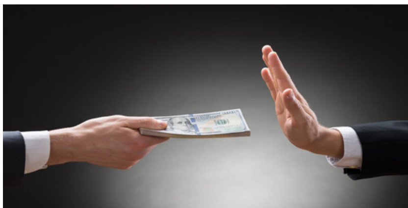
Gráfico 3: Anticorrupción en la gestión pública

El perfil ético del servidor público incluye la capacidad de rendir cuentas de manera clara y oportuna. La rendición de cuentas no solo se limita al cumplimiento de procedimientos legales, sino que también debe reflejar un compromiso ético con la responsabilidad y la coherencia en el uso de los recursos públicos. Además, los servidores públicos deben estar dispuestos a someterse al escrutinio social y aprender de los errores para mejorar continuamente. Así, el perfil ético no solo es un ideal, sino una práctica diaria que contribuye a fortalecer el tejido democrático y el bienestar colectivo (Villoria, 2005).