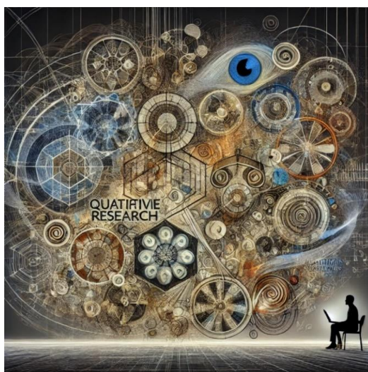
Figura 2: Representación de la magnitud de complejidad en fenómenos estudiados cualitativamente