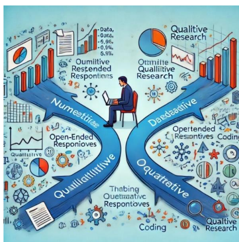
Figura 4: Representación visual de las distintas formas de datos en investigaciones mixtas

En el ámbito de la administración de empresas, la combinación de ambos tipos de datos puede ser especialmente útil. Por ejemplo, mientras que los datos cuantitativos pueden ofrecer una visión global de tendencias y patrones en, por ejemplo, el consumo de bienes y servicios, los datos cualitativos permiten explorar de manera profunda por qué los consumidores se comportan de determinada manera. La integración de ambas perspectivas en un estudio mixto proporciona un panorama más completo y matizado , donde se pueden abordar tanto las dimensiones objetivas como las subjetivas de los fenómenos.