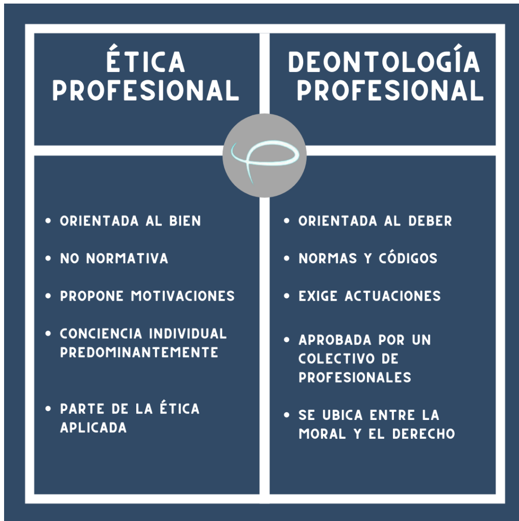
Diferencia entre Ética profesional y Deontología profesional