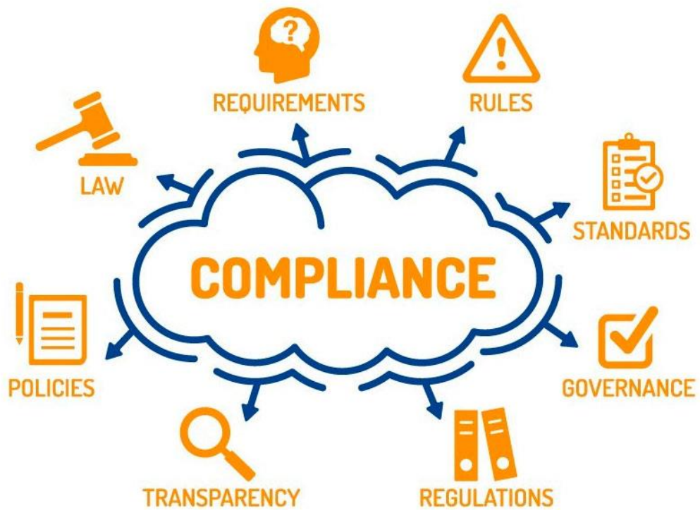
Gráfico 3: Compliance