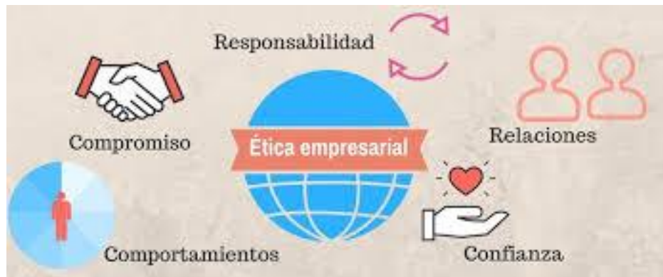
Gráfico 1: Elementos de la ética empresarial