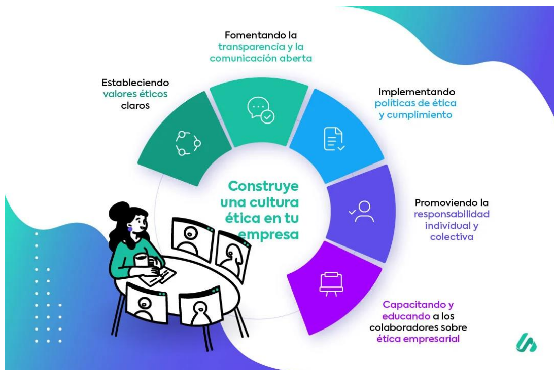
Gráfico 2: Construye una cultura ética en tu empresa