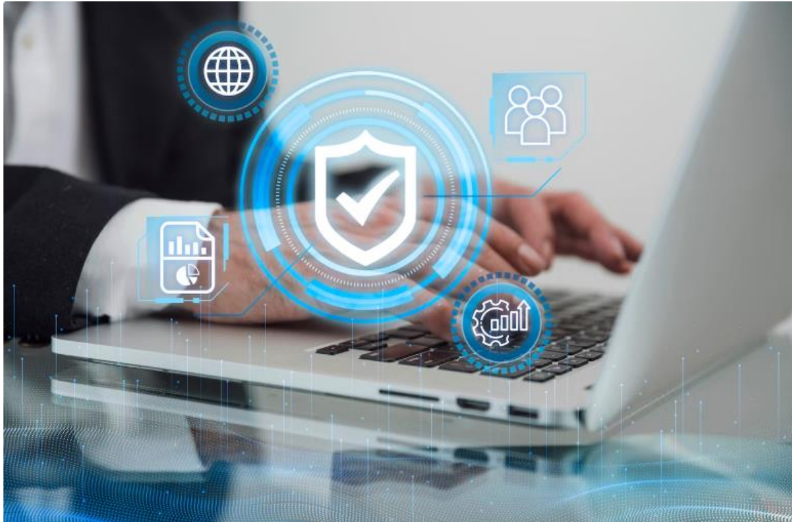
Figura 2. Privacidad y protección de datos