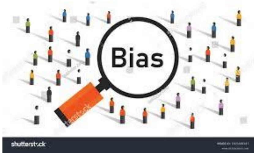
Figura 3. Sesgos en los algoritmos