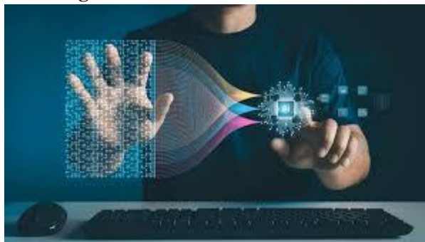
Figura 4. Ética en el análisis de datos