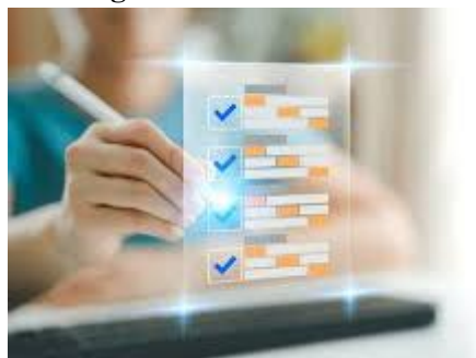
Figura 5. Calidad de los datos educativos