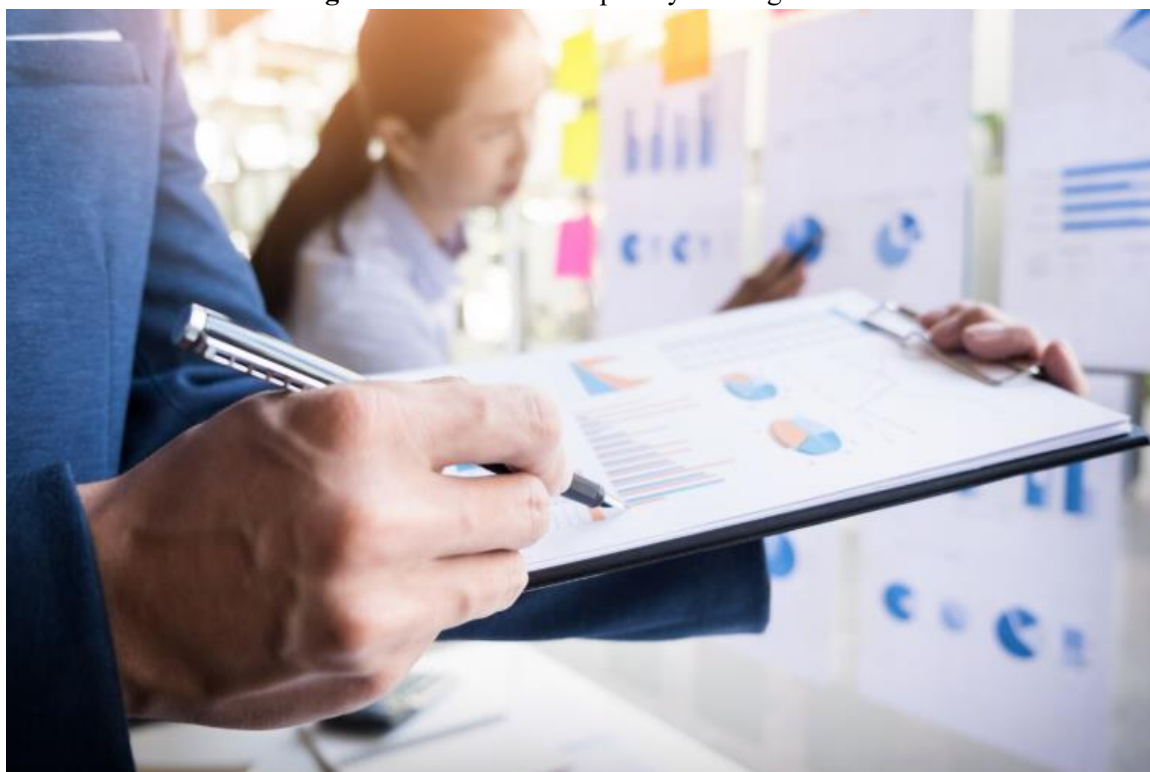
Figura 1. Análisis Descriptivo y de Diagnóstico