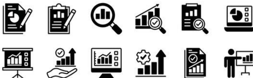
Figura 2. Organización de datos

crucial para garantizar que la información esté disponible de manera coherente y pueda ser interpretada de forma eficiente.