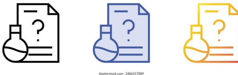
Figura 5. Prueba de hipótesis