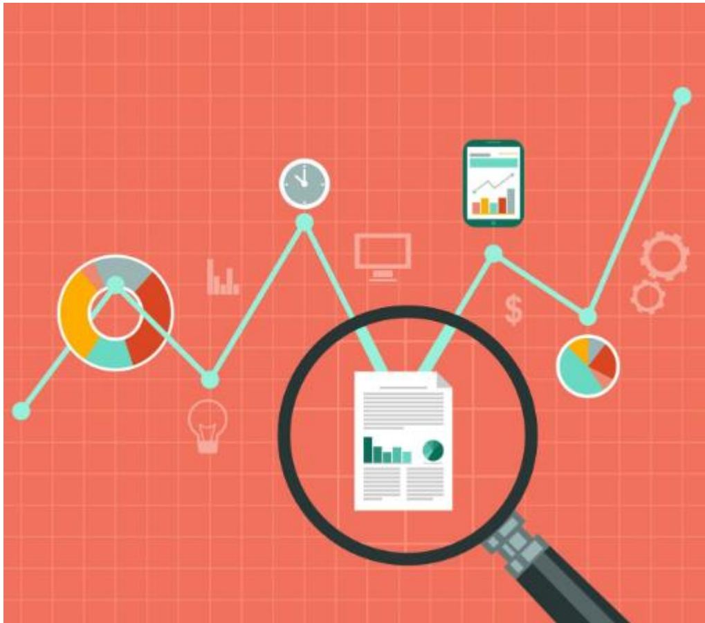
Figura 3. Visualización de datos