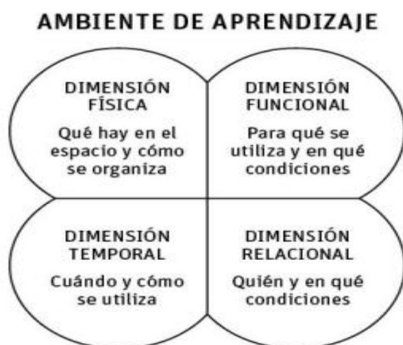
Figura 3. Ambientes de aprendizaje

Nota. Esquema que sintetiza los componentes y relaciones que configuran un ambiente de aprendizaje efectivo (interacciones, recursos, clima socioemocional y organización didáctica) y cómo estos influyen en los procesos y resultados educativos. Adaptado de